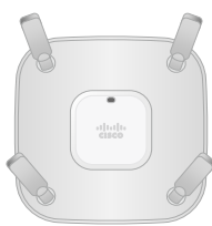
Cisco Systems AIR-CAP3702E-Q-K9 AIR-CAP3702I-Q-K9