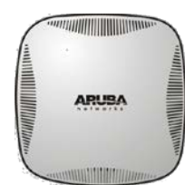
Aruba Networks AP-225